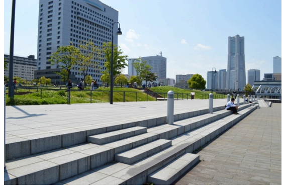
【写真 象の鼻テラス】